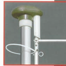
Mastkopf mit Drehausleger