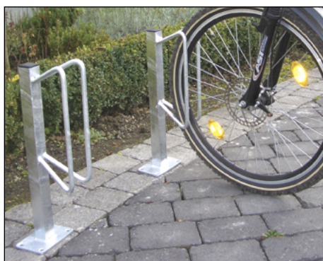
Fahrradständer FSR als Einzelparker